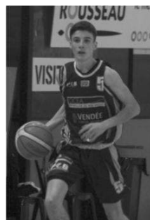
La jeunesse sablaise est appelée à se subjuguier.

Le Pob se rendra salle de la Vie avec l'esprit de revanche, puisque surpris à l'aller sur un tir au buzzer (62-63). L'envie sera-t-elle suffisante ? A l'aller, l'expérience avait fait la différence. La leçon a été retenue depuis.