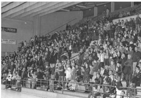
On attend une salle comble samedi.